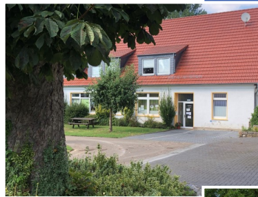
Verwaltung & WG Waldblick